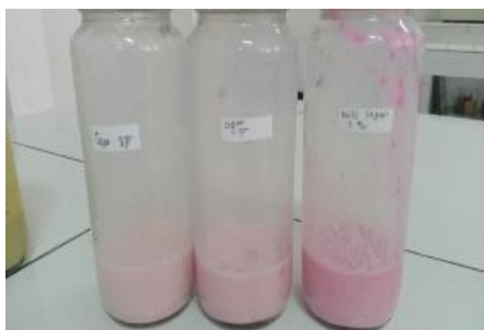
Gambar 1. Hylocereghurt, fortifikasi yoghurt menggunakan kulit buah naga ( Hylocereus polyrhizus )

Secara umum pengujian sifat fisik hylocereghurt menunjukkan bahwa fruitghurt ini memiliki konsistensi cairan yang kental dan agak homogen, berwarna merah muda, dengan rasa asam (Gambar 1). Adanya serbuk kulit buah naga pada proses fermentasi, terdeteksi tidak menyebabkan perubahan rasa jika dibandingkan dengan yoghurt. Karakteristik kimia hylocereghurt (Tabel 1) meliputi pH, kadar lemak, protein, dan asam laktat, semuanya telah memenuhi baku mutu yoghurt menurut SNI 2981 Tahun 2009. Jika dibandingkan dengan yoghurt, terlihat bahwa penambahan kulit bubuk buah naga meningkatkan kadar protein dan lemak. Aktivitas proteolitik bakteri pada starter dapat memecah protein menjadi asam amino yang lebih sederhana sehingga lebih mudah dicerna [7], sehingga hal ini kemungkinan akan menyebabkan peningkatan kadar protein pada hylocereghurt.