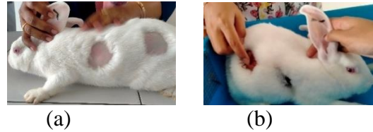
Gambar 3. Kelinci Sebelum (a) dan Setelah Diberi Perlakuan Spray Gel (b)

4 sesuai tingkatan udem dan eritema yang terjadi dan didasarkan pada ketentuan yang dicantumkan pada Tabel 2. Total skor yang dihasilkan digunakan untuk menentukan indeks iritasi primer dan dihasilkan data seperti yang ditunjukkan pada Tabel 4.