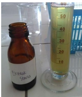
Ekstrak cair daun Stevia

Cara pembuatannya fase minyak (asam stearat, gliserin) dipanaskan di atas penangas air sampai melebur sempurna pada suhu 60^0 - 70^0 C. Fase air (natrium tetraborat, TEA, metal paraben, aquades) dimasukkan dalam fase minyak sedikit demi sedikit dengan diaduk sampai terbentuk massa krim. Ekstrak daun stevia ditambahkan ke basis krim yang telah terbentuk sambil diaduk sampai homogen dan didiamkan sampai suhu kamar. Krim dimasukkan dalam wadah yang cocok dan tertutup rapat.