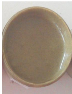
Krim ekstrak stevia